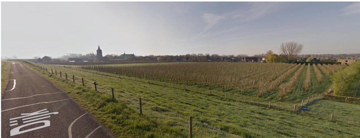
Huidig beeld plangebied

Anima Mundi is gepland in een perenboomgaard onderaan de Dijk nabij kilometerpaal 130 te Winssen. De Dijk is autoluw en wordt gebruikt door bestemmingsverkeer en (recreatief) langzaam verkeer. Tussen de Dijk en de Waal zijn de uiterwaarden aanwezig, deze gronden zijn aangewezen als Natura 2000-gebied. De gronden zijn hier in agrarisch gebruik. Door de uiterwaarden loopt een verharde weg ('Uiterwaard').