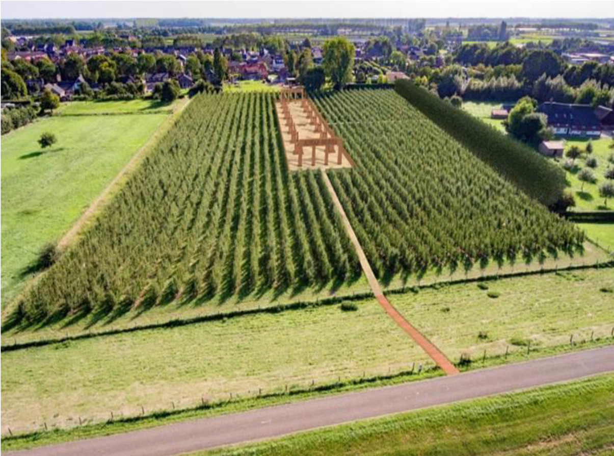
Impressie van het kunstwerk

In Bijlage 1 zijn ter illustratie meerdere afbeeldingen van het kunstwerk opgenomen. Het kunstwerk bestaat dus uit een samenspel van losse objecten met een omvang van circa 14 meter breed x 100 meter lang. Door de onderlinge afstand van de objecten heeft het kunstwerk een transparant karakter en gaat het, gecombineerd met kleur- en materiaalgebruik, een relatie aan met de natuurlijke omgeving van de perenboomgaard. De hoogte van de objecten bedraagt boven maaiveld 6,66 meter op een voet van 0,44 meter. In het midden van het kunstwerk ligt een lichtveld. Het betreft een lichtveld met de projectie van een bloemvorm van 5,55m 2 op de grond.