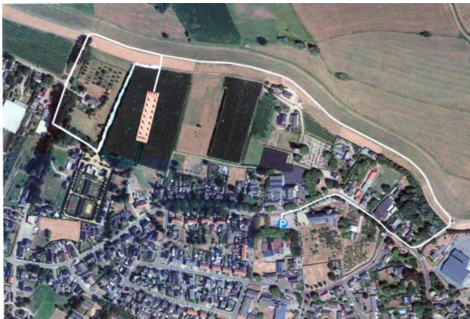
Figuur 10: Weergave van de looproute (in wit).