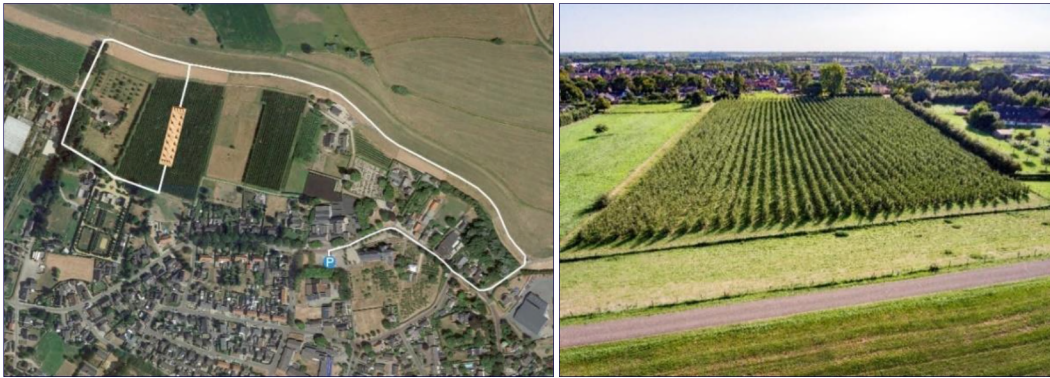
Figuur 1 en 2: De geplande locatie van Anima Mundi, gezien van bovenaf en gezien vanaf de dijk.

In Winssen binnen de gemeente Beuningen is het kunstwerk Anima Mundi gepland. Dit kunstwerk zal geplaatst worden in een al bestaande perenbongerd aan de Dijk.