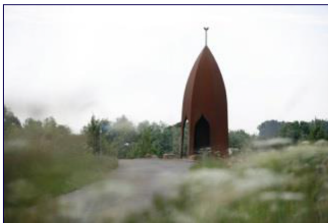
Figuur 7: Nabijgelegen kunstwerk de Dijktempel (onderdeel van de kunstroute Beuningen)

Het is de bedoeling dat Anima Mundi een onderdeel wordt van de Kunstroute Beuningen; een jaarlijks terugkerend tweedaags evenement waarop kunstenaars rondom Beuningen hun werk exposeren. Op ca. 400m afstand van de geplande Anima Mundi staat het kunstwerk de Dijktempel 1 (zie figuur 7). Ook hiervan zijn geen gegevens bekend of en hoe vaak dit kunstwerk wordt bezocht.