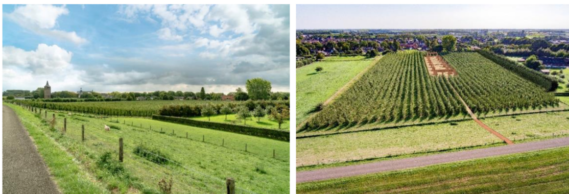
Figuur 8 en 9: Sfeerimpressie kunstwerk Anima Mundi, gezien vanaf de Dijk.

Het landschapskunstwerk Anima Mundi is een zuilengalerij over een lengte van 100 m en een breedte van 14 m. Het bebouwde oppervlak van het totale kunstwerk is 9% en heeft daardoor een open structuur zodat de natuurbeleving sterk wordt benadrukt. Rondom de beelden wordt een zitrand gerealiseerd.