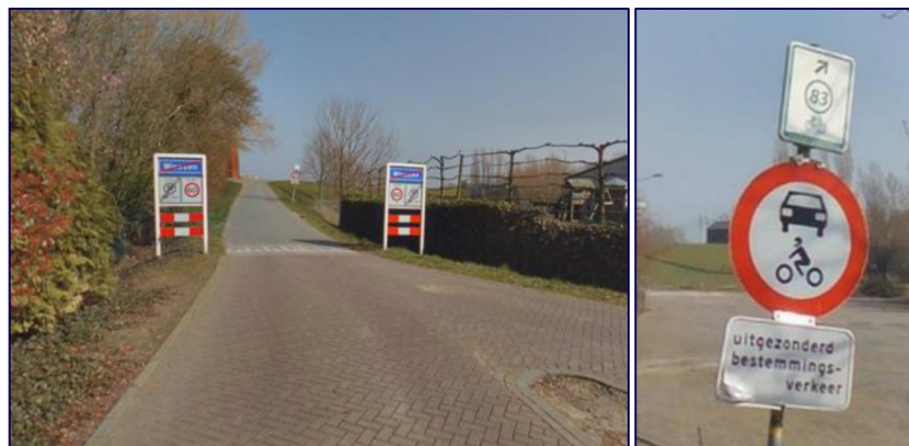
Figuur 4 en 5: De Dijk – 60km/u zone en niet toegankelijk voor alle motorvoertuigen, uitgezonderd bestemmingsverkeer.

Het passeren van twee gemotoriseerde voertuigen met de maximum snelheid is hier niet mogelijk; dit dient met een veel lagere snelheid te gebeuren vanwege de geringe breedte van de weg; auto's moeten bij het passeren deels door de berm. De weg ligt op een dijk met aan één zijde (en over een geringe afstand aan weerszijden) een talud. Hierdoor is het vrij lastig tot onmogelijk om te parkeren aan de zijkant van de weg.